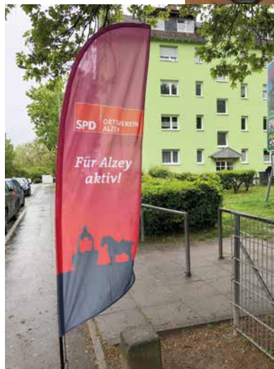
SPD vor Ort im Nibelungenviertel

Die Sozialdemokraten freuen sich sehr darüber, dass als Starterprojekt und damit als erste Maßnahme einer langen Liste, aktuell die dringend erforderliche Erweiterung des Jugend- und Kulturzentrums angegangen werden kann und sehen den weiteren Schritten des Projekts, die sie selbstverständlich eng begleiten werden, mit Spannung entgegen.