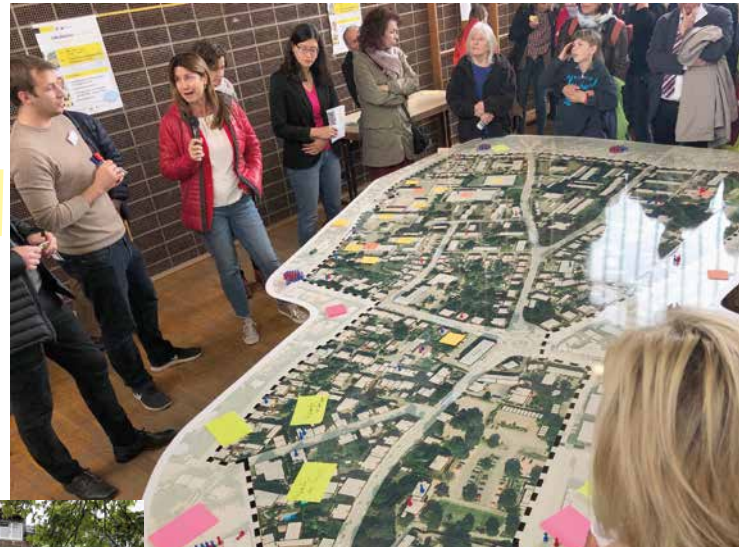
Bürgerbeteiligung: Diskussion der Planungen in der Halle der Nibelungenschule

Mit dieser Umnutzung des Geländes des Alten Schlachthofs, wird die Weiterentwicklung im dem gesamten Gebiet am deutlichsten sichtbar. Aber auch die Neugestaltung des Schlossparks, für den das ursprünglich abgesteckte Fördergebiet