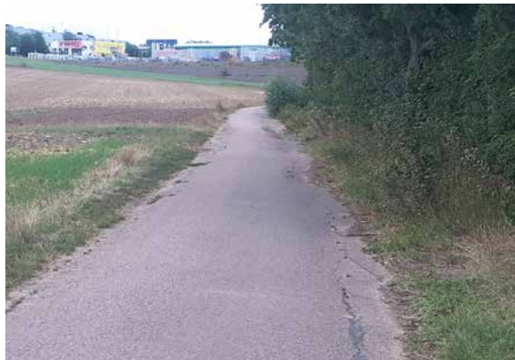
Hier muss der Selztalradweg dringend ausgebaut werden.

„Wir sind davon überzeugt, dass einige Verbesserungen kurzfristig umsetzbar sind. Dazu gehört zum Beispiel die Prüfung der Freigabe der Fußgängerzone