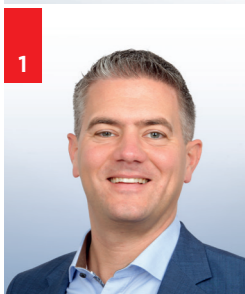
1 STEFFEN JUNG 40 Jahre Bürgermeister