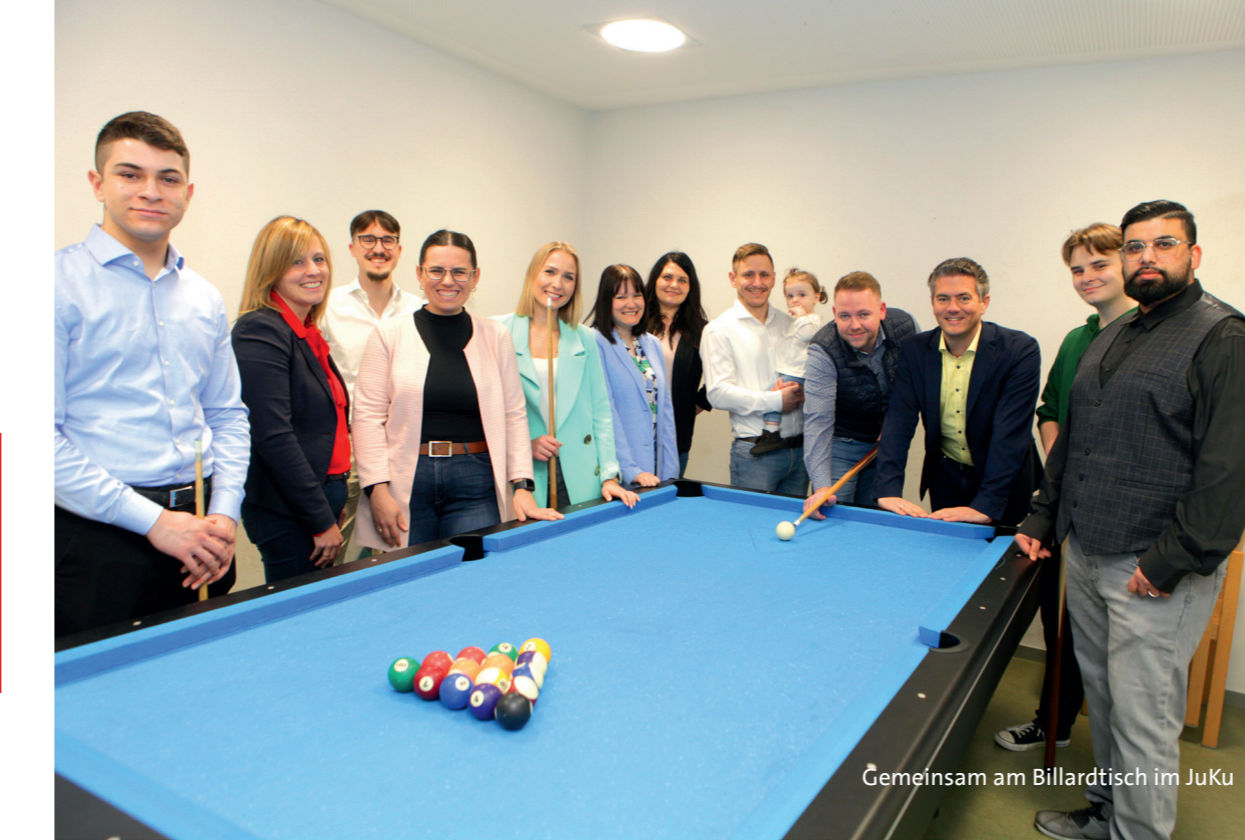
Gemeinsam am Billardtisch im JuKu

JUNGE POLITIK DURCH JUNGE MENSCHEN! Ich gehe wählen, weil #meineStimmezählt!