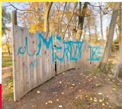
Holzwand auf dem Jugend- und Freizeitgelände Am Herdry

Das Team des JuKu hätte sich gegenüber der Idee sehr aufgeschlossen und interessiert gezeigt, berichten die Sozialdemokraten abschließend.