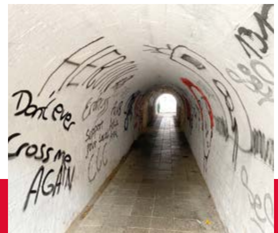
Das „Gänsebrückelchen“ wurde erneut stark verunstaltet