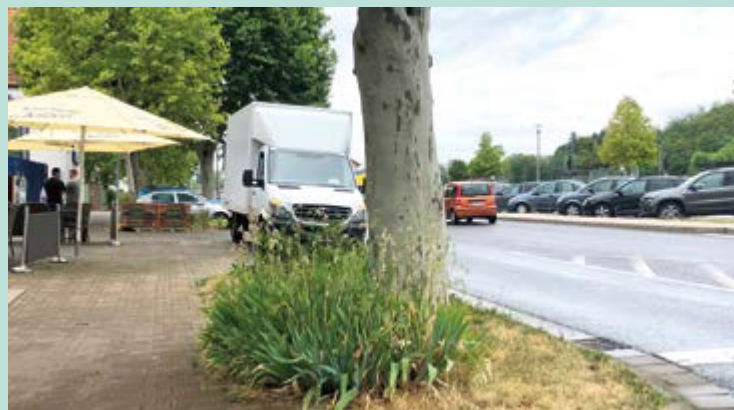
Typische Situation am Bahnberg: Wenig Sicht nach links