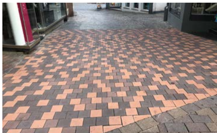
Der Bereich zwischen Roßmarkt und St.-Georgen-Straße wurde auf unsere Anregung hin neu geplastert.