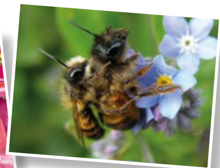
5.000 Saatmischungen wurden im Frühjahr ausgegeben