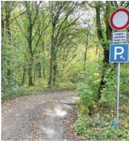
Die Zuwegung zum Parkplatz ist in schlechtem Zustand

Bereits in der Sitzung des Ausschusses für Bauen am 26. September 2019 hat Klaus Kübler, für die SPD Mitglied des Ausschusses, die Ausbesserung der Zuwegung zum Alzeayer Trimm-dich-Pfad angeregt.