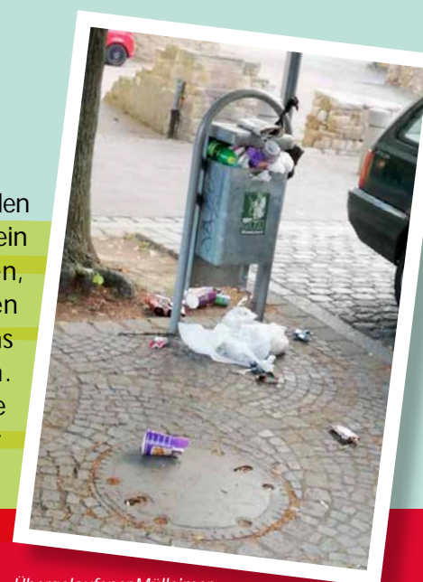
Übergelaufener Mülleimer auf dem Kronenplatz

Trennsystem genutzt werden können. Außerdem sollte ein Modell gefunden werden, das dem Müllaufkommen in Form von Pizzakartons gerecht werden kann. Immer wieder müssen die engagierten Mitarbeiter des städtischen Bauhofs,