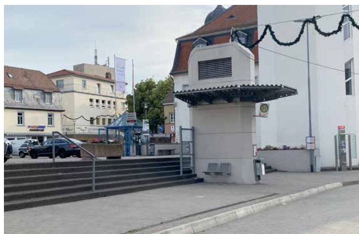
Die Bushaltestelle „Tiefgarage“ in der Hospitalstraße soll im Rahmen des Neubaus der Steinhalle barrierefrei ausgebaut werden.

„Wir bleiben weiter am Ball und werden auf die im Nahverkehrplan vorgesehene Umsetzung drängen. Allerdings haben wir die Befürchtung, dass diese bis 2022 nicht komplett möglich sein wird. Da uns auch immer wieder Anfragen von Bürgerinnen und Bürgern mit Beeinträchtigungen erreichen, die über die schwer nutzbaren Haltestellen klagen, erachten wir dies aber für sehr wichtig“ so Ausschussmitglied Klaus Kübler.