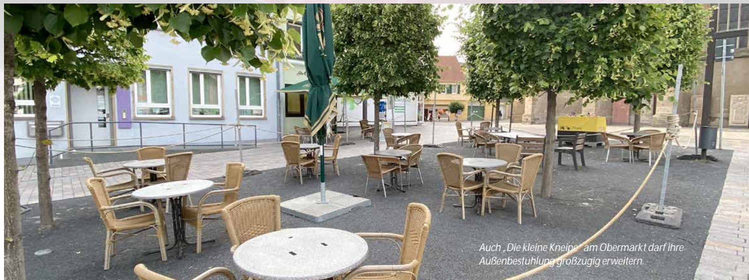
Auch „Die kleine Kneipe“ am Obermarkt darf ihre Außenbestuhlung großzügig erweitern.

Im Mai wurde im Stadtrat das Hilfspaket „Gemeinsam für Alzey“ beschlossen. Hiermit sollen die von der Corona-Krise besonders betroffenen Bereiche Wirtschaft, Familie/Soziales und Kultur unterstützt werden.