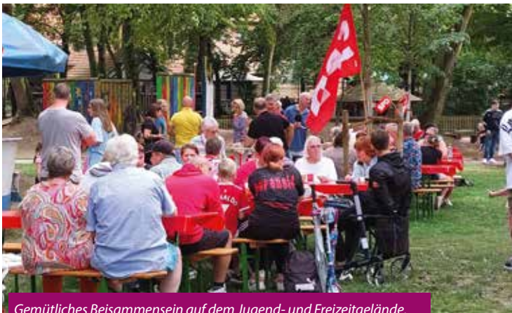
Gemütliches Beisammensein auf dem Jugend- und Freizeitgelände.

Gegen 18 Uhr gab es zum Abschluss für alle Kinder und Jugendlichen dann noch eine Kugel Eis und das Sommerfest 2023 ging zu Ende.