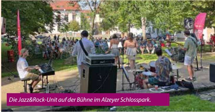
Die Jazz&Rock-Unit auf der Bühne im Alzeyer Schlosspark.

Beste Stimmung beim Schlossparkkonzert mit der Jazz&Rock Unit der Kreismusikschule Alzey-Worms. Vielen Dank an alle Besucherinnen und Besucher, die im Schatten der Bäume im Schlosspark saßen und die Band nicht ohne Zugabe von der Bühne ließen.