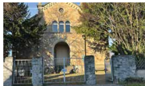
Die Eingangstore des Hauptfriedhofs sollen künftig auch nachts geöffnet bleiben. Die SPD-Fraktion sieht dies sehr kritisch.

Schließung, zumal es in der Vergangenheit bereits zu Diebstählen gekommen sei. Leider sah dies nur die SPD so, alle anderen Ausschussmitglieder stimmten für die dauerhafte Öffnung des Hauptfriedhofs. Die SPD-Fraktion wird diese Entwicklung kritisch begleiten.