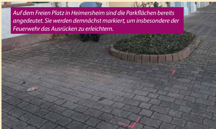
Auf dem Freien Platz in Heimersheim sind die Parkflächen bereits angedeutet. Sie werden demnächst markiert, um insbesondere der Feuerwehr das Ausrücken zu erleichtern.

Diese Modernisierung ist ein wichtiger Schritt, um die Mobilität und Erreichbarkeit für alle Bürgerinnen und Bürger zu verbessern.