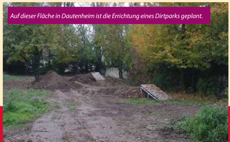
Auf dieser Fläche in Dautenheim ist die Errichtung eines Dirtparks geplant.

Im Stadtteil Dautenheim soll ein Dirtpark (ein Gelände, das von Mountainbikern und BMX-Fahrern genutzt werden kann) entstehen. Durch eine gemeinsame Aktion des Ortsbeirats und der „Initiative Dirtpark“ konnte am 28. September ein wichtiger Schritt nach vorne gemacht werden: Das Gestrüpp wurde mit einigen Anhängerfuhren auf die Deponie des Bauhofs gebracht und Ende Oktober wurde Erde angeliefert, so dass der Dirtpark nun modelliert werden kann. Hierzu folgte Ende November bereits ein weiterer Arbeitseinsatz. Kornelia Kopf, Ortsvorsteherin in Dautenheim, zeigt sich zufrieden mit dem Ablauf: „Wenn die Witterung mitspielt, sollte der Dirtpark im Frühjahr fertiggestellt sein.“