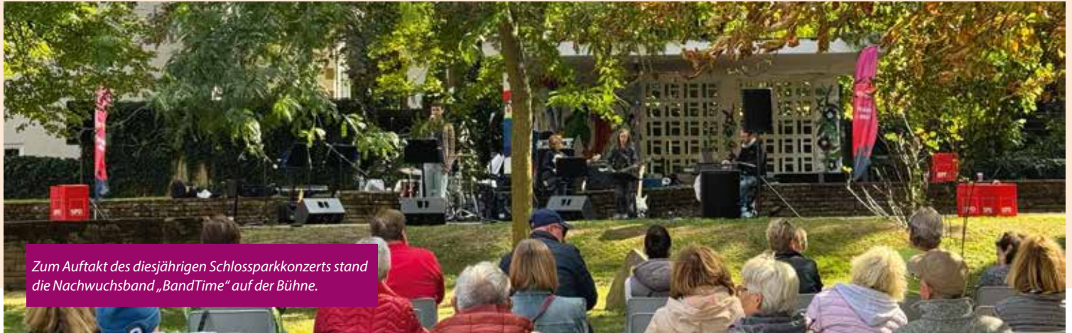
Zum Auftakt des diesjährigen Schlossparkkonzerts stand die Nachwuchsband „BandTime“ auf der Bühne.

SPD-Ortsverein im September ein Schlossparkkonzert, um den schönen Schlosspark mitten in der Stadt zu beleben und eine alte Tradition zu bewahren.