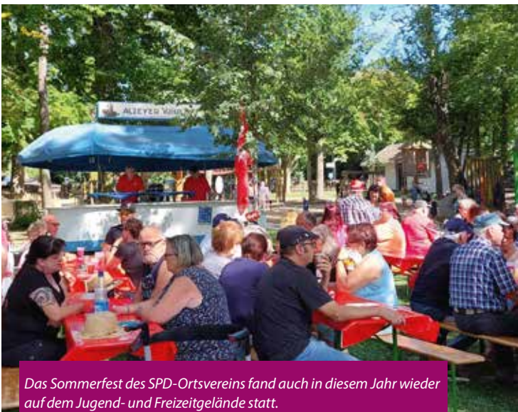
Das Sommerfest des SPD-Ortsvereins fand auch in diesem Jahr wieder auf dem Jugend- und Freizeitgelände statt.

Auch in diesem Jahr konnte der SPD-Ortsverein wieder ein sehr gelungenes und schönes Sommerfest auf dem Jugend- und Freizeitgelände feiern. Der Dank gilt allen Besucherinnen und Besuchern sowie allen Helferinnen und Helfern für einen tollen Tag. Leider stand in diesem Jahr die Eisenbahn wegen eines Defektes nicht zur Verfügung. Die SPD-Fraktion hofft, dass der beliebte Volker-Express im nächsten Jahr wieder seine Runden drehen wird.