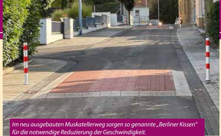
Im neu ausgebauten Muskatellerweg sorgen so genannte „Berliner Kissen“ für die notwendige Reduzierung der Geschwindigkeit.