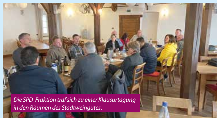
Die SPD-Fraktion traf sich zu einer Klausurtagung in den Räumen des Stadtweingutes.

Dennoch sind Themen wie die Entwicklung der Innenstadt sowie Investitionen in die Bildungsinfrastruktur der Fraktion